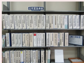
学習指導案コーナー